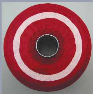
Avec Cyclanon® XC-W