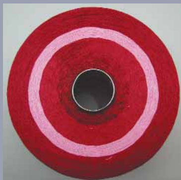
Sans Cyclanon® XC-W